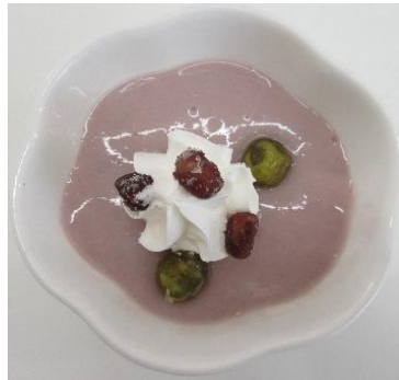
あずきミルクプリン