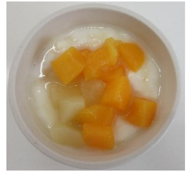
桃とはちみつのヨーグルト